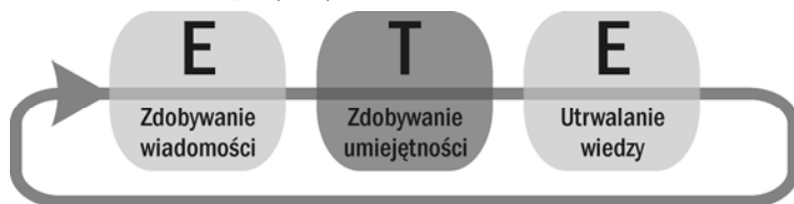
Rys. 2. Schemat trójfazowego szkolenia blended learning .

Ten klasyczny trójfazowy tryb blended learning często rozbudowuje się do szkolenia pięcioetapowego [12].